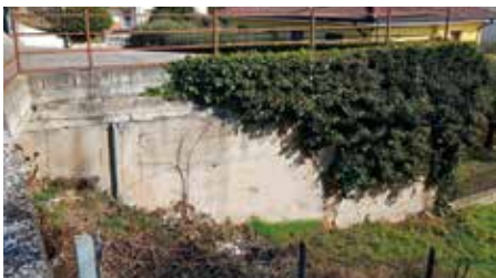
Il muro in Via Valle