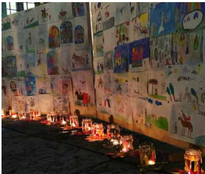
Disegni dei bambini