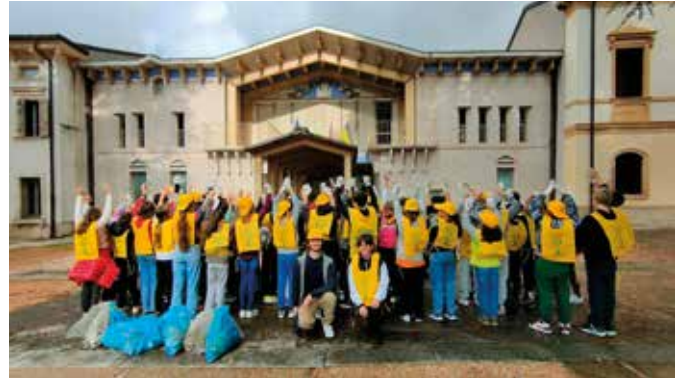
L'onda gialla in azione per le vie del Comune

diffondere tra amici e parenti le buone pratiche di pulizia soprattutto per quanto riguarda i rifiuti più comuni quali mozziconi di sigarette.