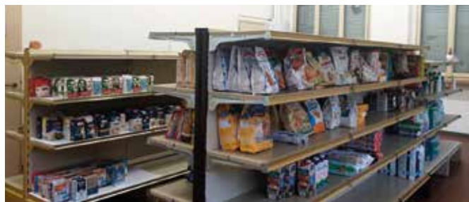
Bottega della Carità a Cogollo

La Caritas è la risposta concreta della comunità cristiana a chi è in difficoltà. La Caritas dell'Unità Pastorale è rivolta a tutte le persone delle parrocchie da Illasi a Giazza e di quelle dell'Unità Pastorale Lessinia Orientale. Ci sono più servizi offerti tra i quali: il Centro di Ascolto, aperto il sabato mattina dalle 9.30 alle 11.30 a Cogollo presso le ex scuole elementari. Sempre a Cogollo la Bottega della Carità, aperta il martedì mattina dalle 9.00 alle 11.30. Il Centro di Ascolto e la Bottega della Carità si svolgono in luoghi messi a disposizione del Comune. Il Progetto Case-Carità, attivo in collaborazione con i Servizi Sociali, prevede la messa a disposizione di appartamenti per persone bisognose che necessitano di un'abitazione per un periodo limitato. Il progetto di Counselling, un servizio di accompagnamento proposto a chi si rivolge alla Caritas, svolto da un volontario adeguatamente formato. Il numero della Caritas UPVI è 351/8218874.