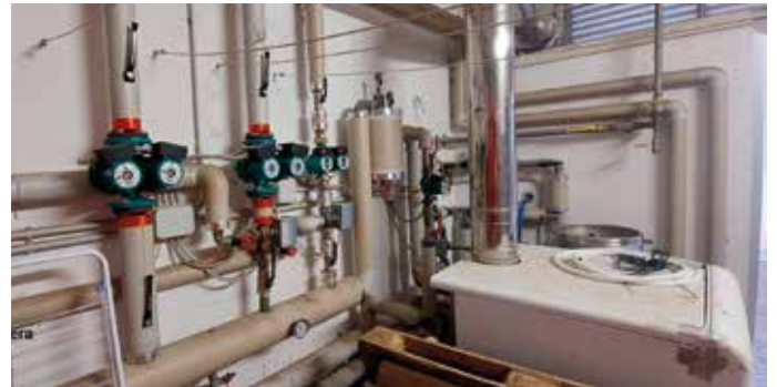
Centrale termica dello stadio

Un'opera necessaria per consentire la fruizione senza disagi degli spogliatoi da parte degli sportivi e un conseguente risparmio economico sui consumi di gas.