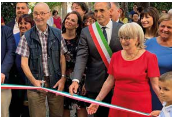
L'amministrazione comunale al taglio del nastro

che questa iniziativa abbia successo, continuità ed ulteriori applicazioni. Altro tema di attualità nell'ambito dell'assistenza alla persona anziana è l'implementazione dei servizi domiciliari. La Fondazione Zerbato, in collaborazione con ULSS 9 e altri enti del territorio, si sta adoperando, pur nella contingenza della carenza di professionisti del settore, per dare delle risposte concrete alla popolazione del nostro territorio ampliando questi servizi. Obiettivo della Fondazione è di gestire, sostenere e supportare ogni espressione della senilità, dalle piccole difficoltà, anche esclusivamente pratiche, alle manifestazioni più impegnative della salute in vecchiaia, offrendo così supporto ai familiari e garantendo loro una maggiore tranquillità. Questa serie di progetti ci permettono di essere pronti alle sfide che il futuro a breve e medio periodo ci presenta. Invitiamo i cittadini interessati a contattarci per ulteriori informazioni sulle iniziative in corso, che rappresentano un importante passo avanti verso il futuro del nostro ente, grazie all'impegno quotidiano del nostro personale e della direzione.