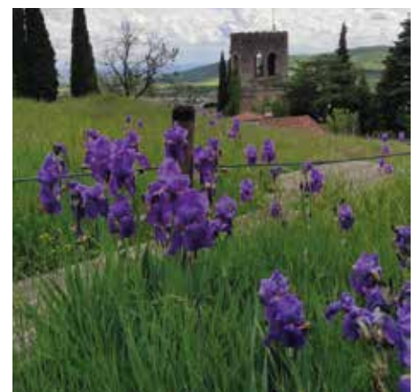
I fiori dell'Iris

che per la realizzazione di profumi. Le leggende su questo fiore risalgono all'antica Grecia: secondo la mitologia la dea Iris, messaggera degli dei e personificazione dell'arcobaleno, collegava il cielo e terra, l'umanità e l'Olimpo.