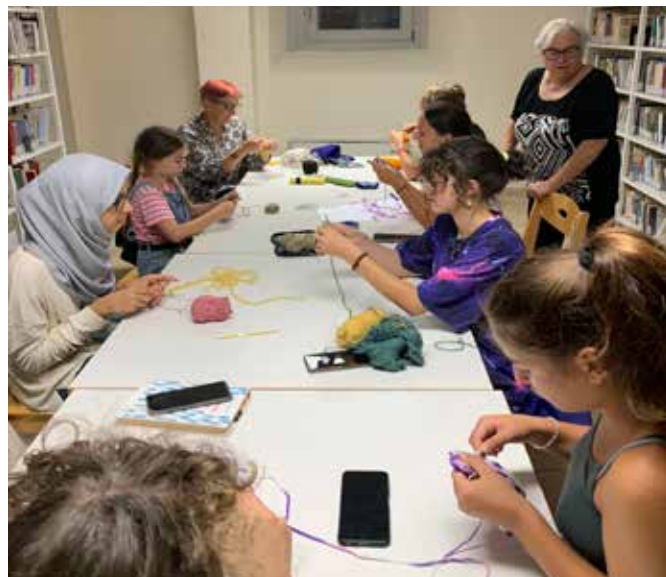
Laboratorio in biblioteca

E in programma l'apertura di aule studio della biblioteca per studenti universitari nelle mattine di martedì, mercoledì e giovedì dal mese di gennaio a cura di volontari. Se anche tu vuoi renderti disponibile a coprire qualche turno, contatta la biblioteca.