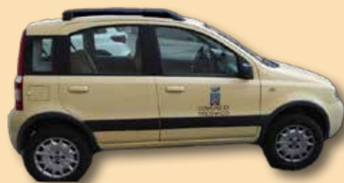
L'auto a disposizione della collettività

Ricordiamo il servizio TRASPORTO SOCIALE per richieste e nuovi autisti contattare il numero: 347/573342