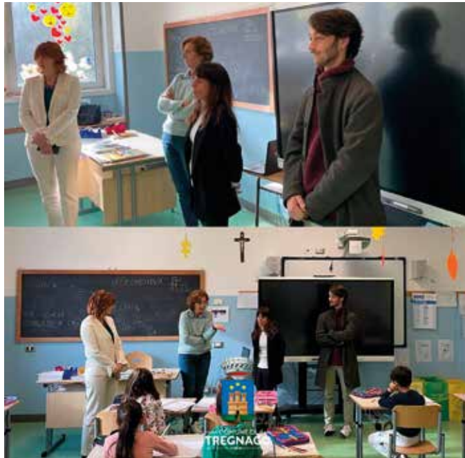
Amministrazione e dirigente salutano le classi

ragazzi e ragazze che mi aspettano nelle loro classi e sezioni sempre con tanto entusiasmo e anche dall'Amministrazione che si è mostrata fin da subito attenta alle esigenze del nostro istituto. L'accoglienza mi è stata fin da subito dimostrata anche dalle famiglie per le quali mi impegno nel lavoro quotidiano per garantire una scuola in cui tutti i bambini siano felici di andare e tutte le famiglie possano trovare un punto di riferimento per l'educazione e l'istruzione permanente”.