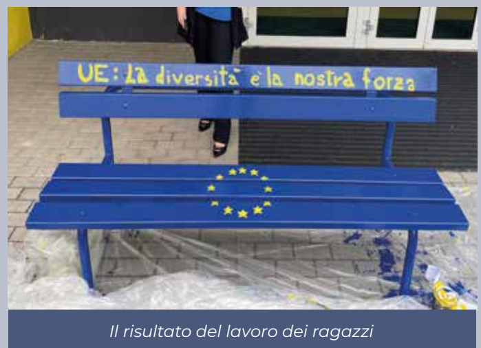
Il risultato del lavoro dei ragazzi