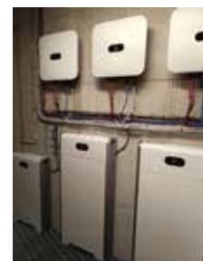
I lavori di efficientamento realizzati al Polo scolastico e al Palasport