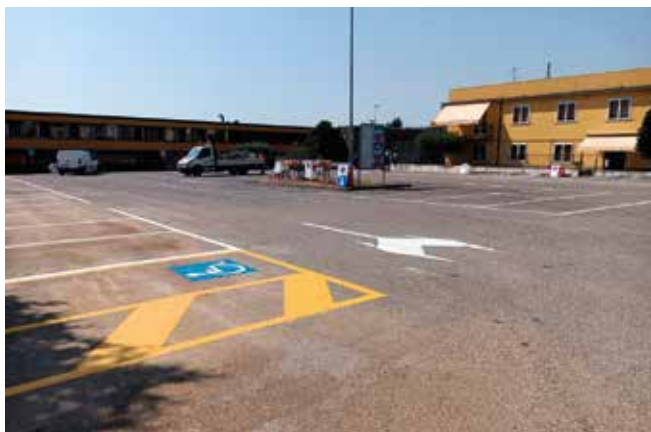
I lavori eseguiti nel parcheggio del Piazzale Kennedy

La spesa totale per i due interventi è stata di circa 11.000 euro.