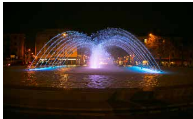
Esempio illuminazione fontana

Dopo essere rimasta "a secco" per oltre dieci anni, la storica fontana di piazza Massalongo finalmente tornerà a riempirsi d'acqua per volere dell'amministrazione comunale di Tregnago. Questa volta, però, non si tratterà di quel liquido sporco e stagnante che periodicamente si accumula sul fondo della vasca, ma di acqua molto più pulita che verrà messa in circolo da un sistema di pompa filtrante che dovrà contribuire a renderla tale anche in futuro.