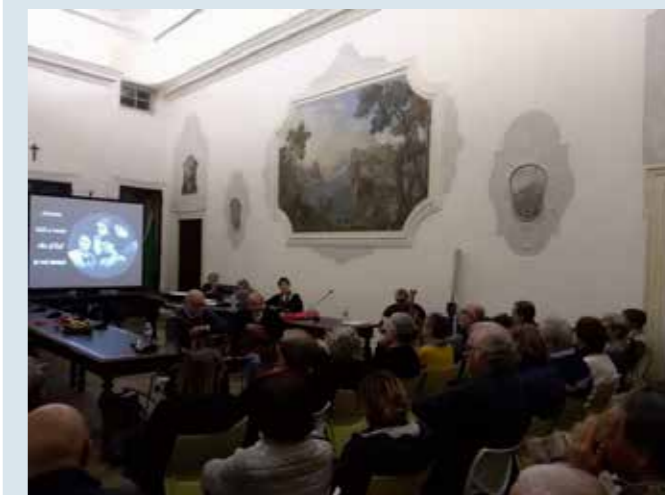
Inaugurazione lezioni nella sala consiliare del municipio - 13 ottobre 2018

È iniziato in ottobre il terzo anno accademico dell'Università del Tempo Libero, iniziativa organizzata dall'assessorato alla cultura, dalla biblioteca comunale, dall'associazione culturale Arte & Parte e dal gruppo CIF. Anche quest'anno gli incontri, che stanno avendo una buona partecipazione, si svolgono presso la sede del Circolo Anziani in vicolo Carlo Cipolla ogni mercoledì dalle 15.30 alle 17. Le tematiche trattate sono varie: ogni settimana un argomento diverso.