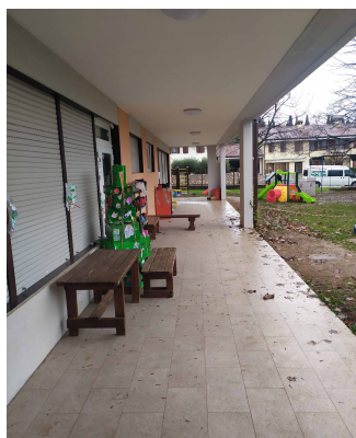
pavimentazione sotto ai portici