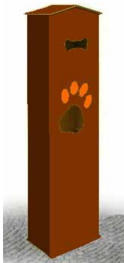
cestino deiezioni canine

Questa iniziativa, oltre a mettere a disposizione idonei contenitori per il tipo di rifiuto, richiama anche alla responsabilità e al senso civico chiunque conduca a passeggio il proprio cane a garanzia