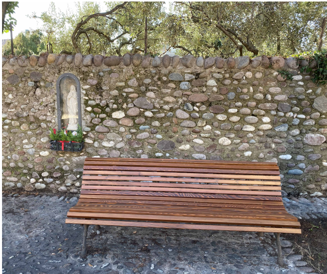
dopo il restauro

Prosegue il lavoro di ammodernamento degli arredi urbani e la manutenzione di quelli esistenti recuperabili. Negli ultimi mesi è stato avviato un processo di recupero e restauro di numerose panchine in legno ormai ammalorate e aggredite dagli agenti atmosferici, fra queste vi sono quelle vicino alla Vasca su via San Martino, quelle di via Cavour, via Prà Possaigo, piazza Bevilacqua e via Cipolla, prossimamente saranno restaurate anche le quattro presenti