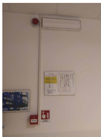
controsoffitto fonoassorbente, lampade a led, impianto di condizionamento e allarme incendio