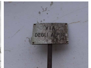
vecchia targa viaria