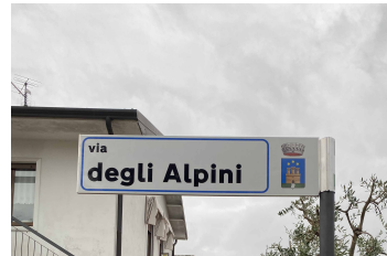
nuova targa viaria

È iniziata da tempo ed ormai giunge a termine la sostituzione di circa un centinaio di targhe viarie risalenti agli anni Ottanta, ancora presenti in molte zone del capoluogo e delle frazioni; il modello che è stato adottato prevede il nome della via su entrambi i lati e delle pellicole rifrangenti che riportano lo stemma del Comune di Tregnago.