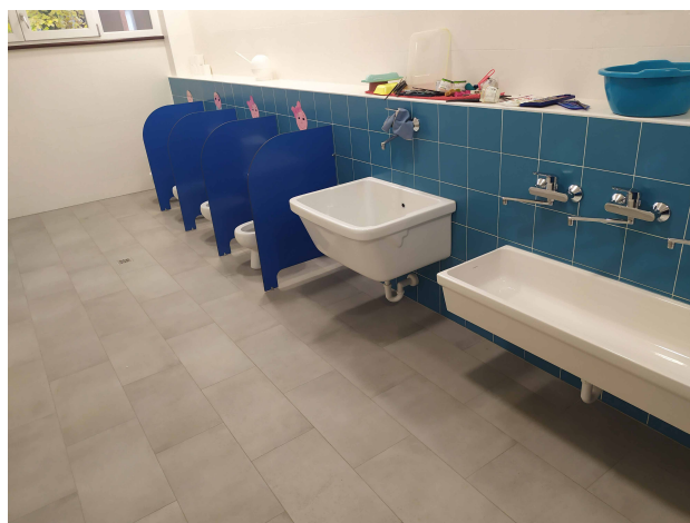
pavimentazione/rivestimenti e sanitari bagni