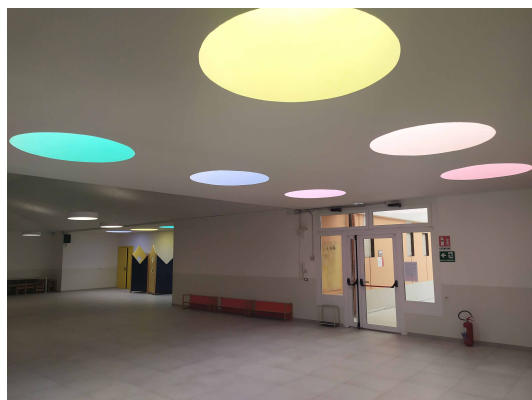
riscaldamento a pavimento, nuova pavimentazione, porte aule e tinteggiature salone di ingresso