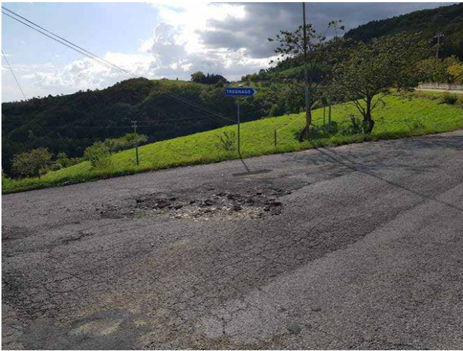
strada da sistemare

Per quanto riguarda alcuni tratti della viabilità comunale in evidente stato di degrado, è stata recentemente preparata la progettazione degli interventi di manutenzione e nei