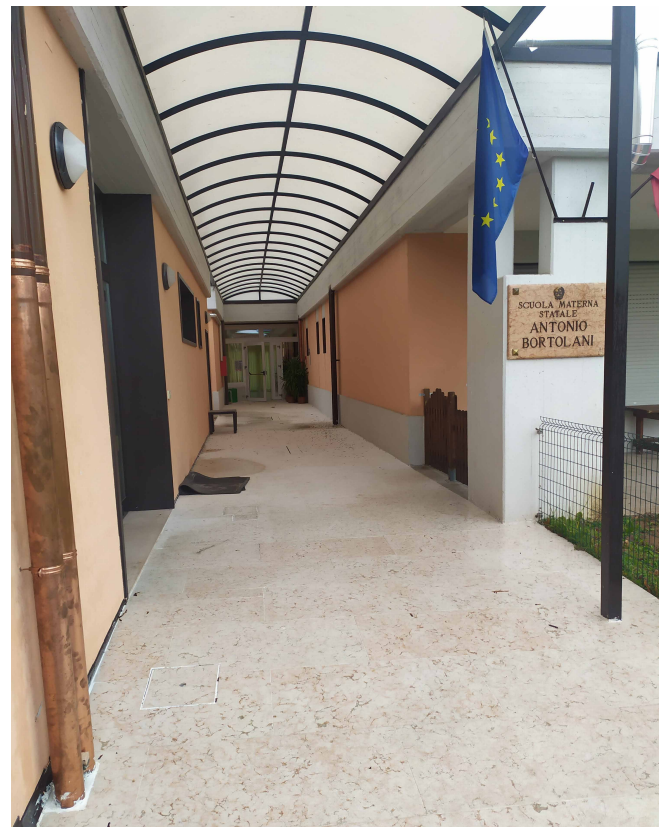
pavimentazione ingresso principale