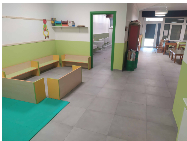
tinte e riscaldamento sotto nuovo pavimento aule